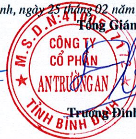
Trương Đình Xuân

(Các thuyết minh từ trang 12 đến trang 29 là bộ phận hợp thành của Báo cáo tài chính)